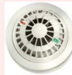
De optische rookmelder

Speciale paniekzenders zijn verkrijgbaar voor de senioren onder ons, brandmelders zullen u waarschuwen indien er brand dreigt uit te breken. Want WIE maakt U wakker als u slaapt ?